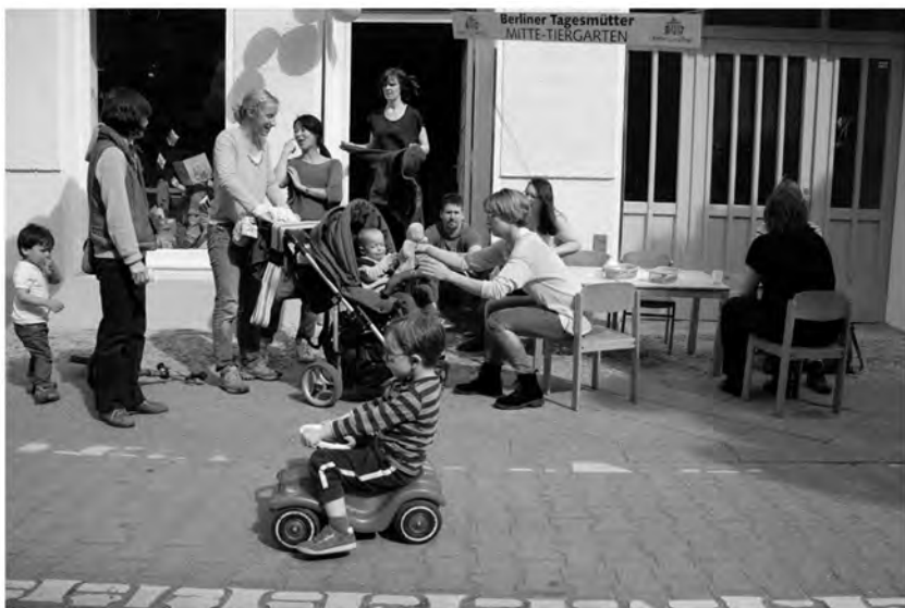
Die Fotos zeigen Eindrücke vom 1. Tag der offenen Tür am 17.5.2014